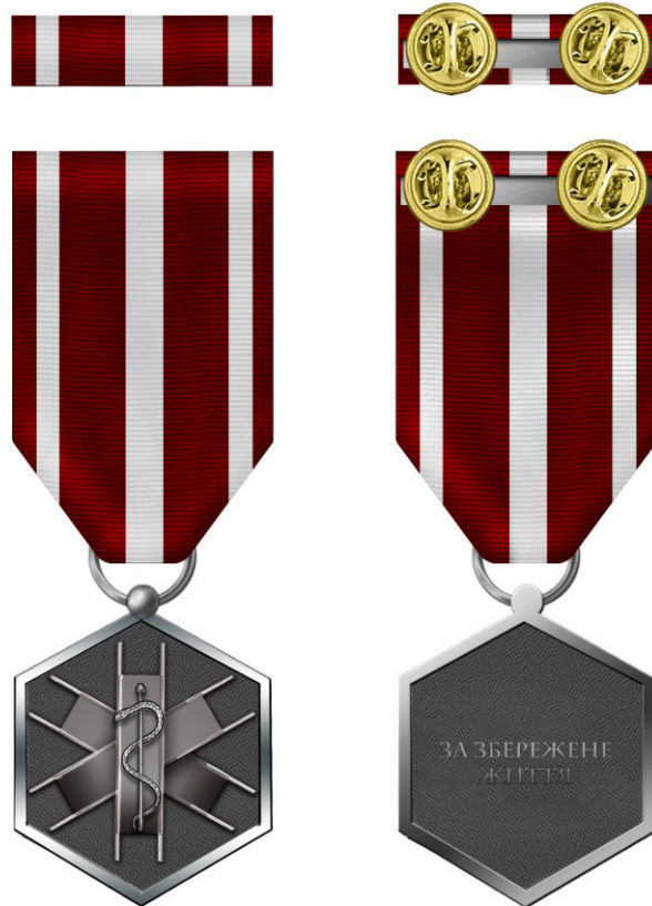
Рисунок Д1.1 – Зовнішній вигляд предмета