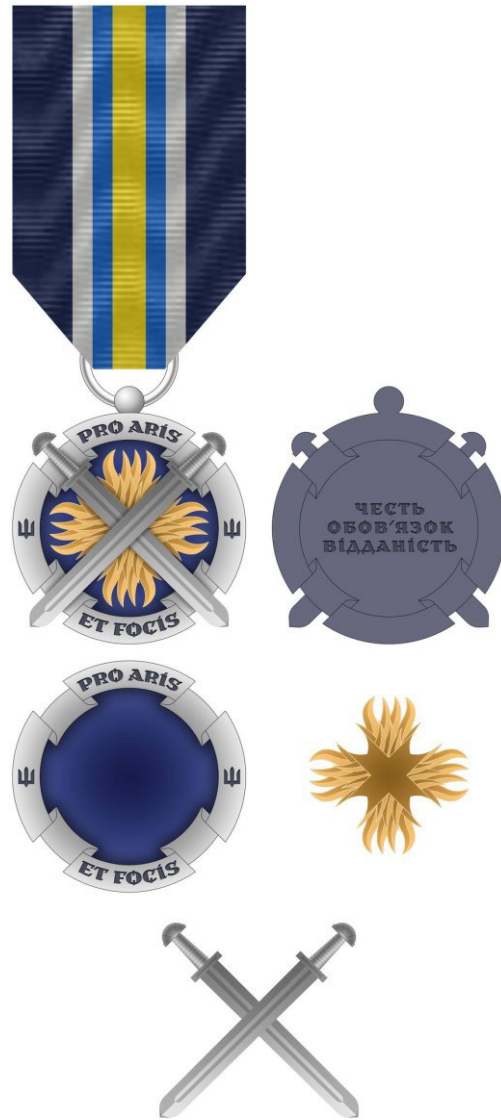
Рисунок Д1.1 – Зовнішній вигляд предмета