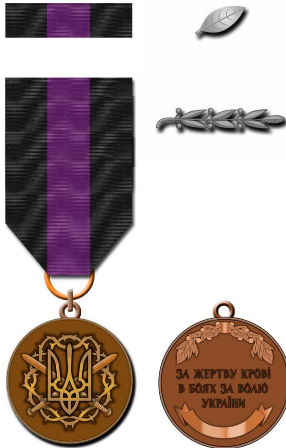
Рисунок Д1.1 – Зовнішній вигляд предмета