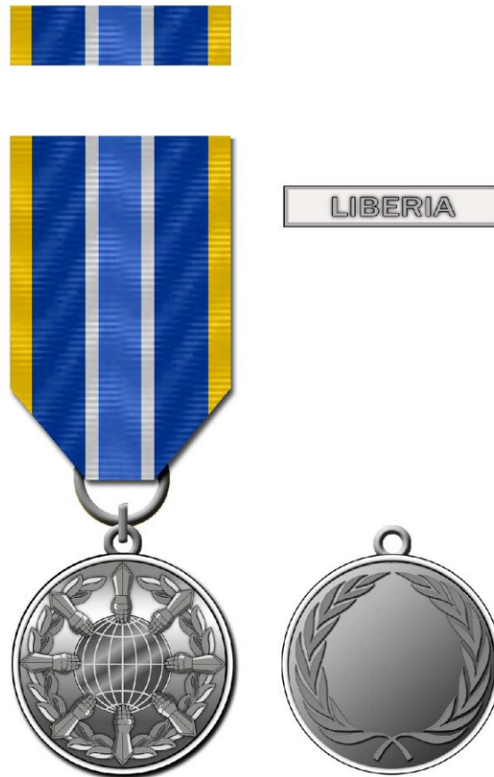
Рисунок Д1.1 – Зовнішній вигляд предмета