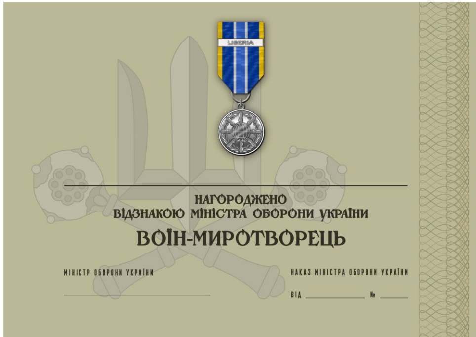
Рисунок 57 – Сертифікат до відомчої заохочувальної відзнаки Міністерства оборони України “Воїн-миротворець” (надпис на планці визначається замовником)