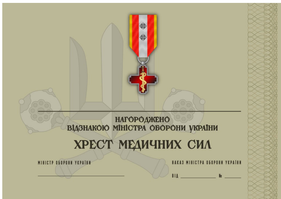
Рисунок 44 – Сертифікат до відомчої заохочувальної відзнаки Міністерства оборони України “Хрест Медичних сил”