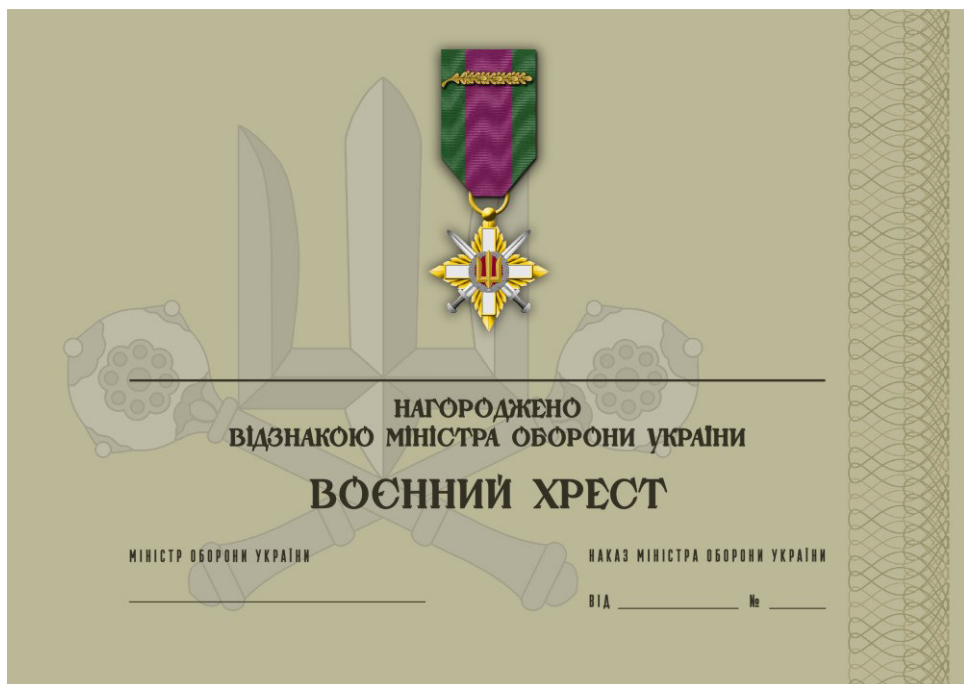
Рисунок 6 – Сертифікат до відомчої заохочувальної відзнаки Міністерства оборони України “Воєнний хрест”