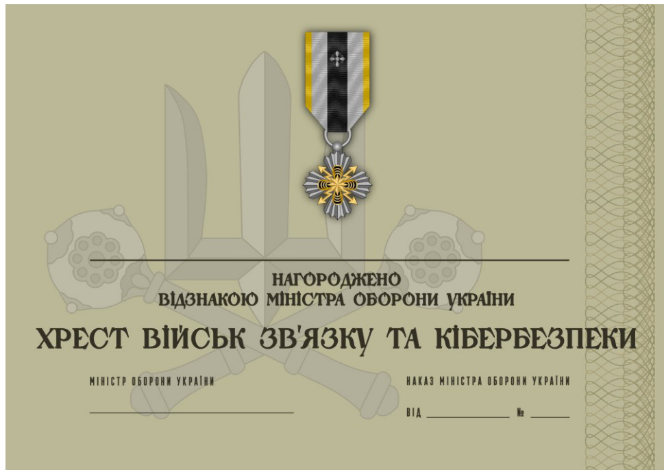
Рисунок 49 – Сертифікат до відомчої заохочувальної відзнаки Міністерства оборони України “Хрест Військ зв’язку та кібербезпеки”