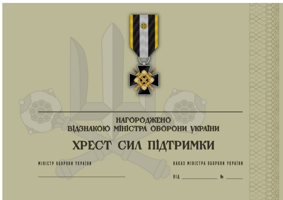
Рисунок 40 – Сертифікат до відомчої заохочувальної відзнаки Міністерства оборони України “Хрест Сил підтримки”