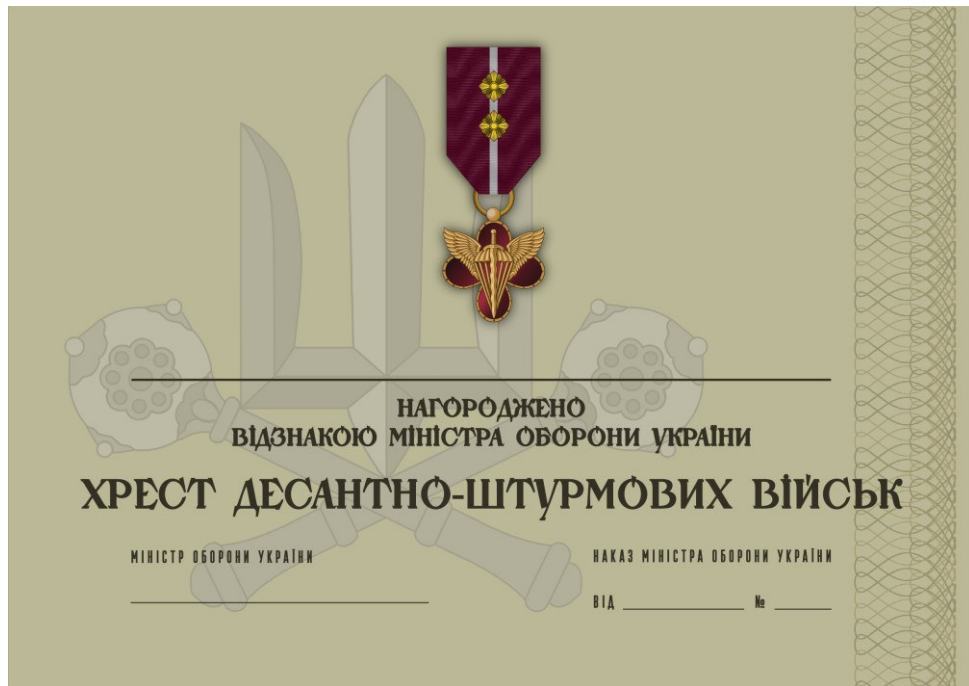
Рисунок 47 – Сертифікат до відомчої заохочувальної відзнаки Міністерства оборони України “Хрест Десантно-штурмових військ”