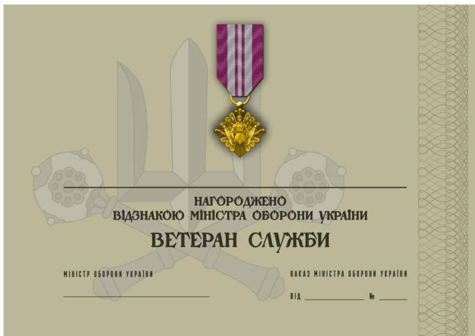
Рисунок 58 – Сертифікат до відомчої заохочувальної відзнаки Міністерства оборони України “Ветеран служби”