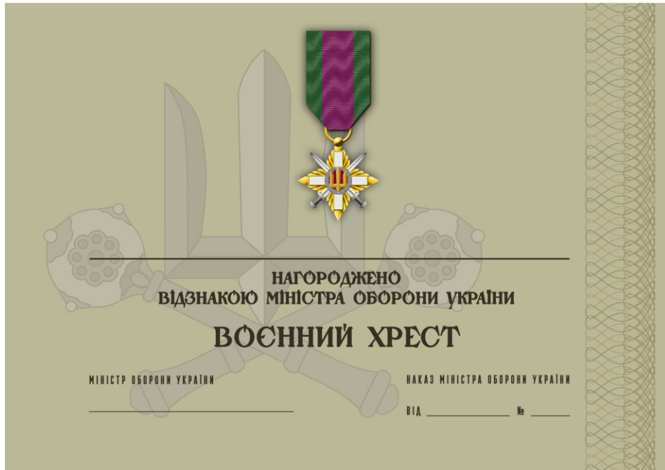
Рисунок 5 – Сертифікат до відомчої заохочувальної відзнаки Міністерства оборони України “Воєнний хрест”