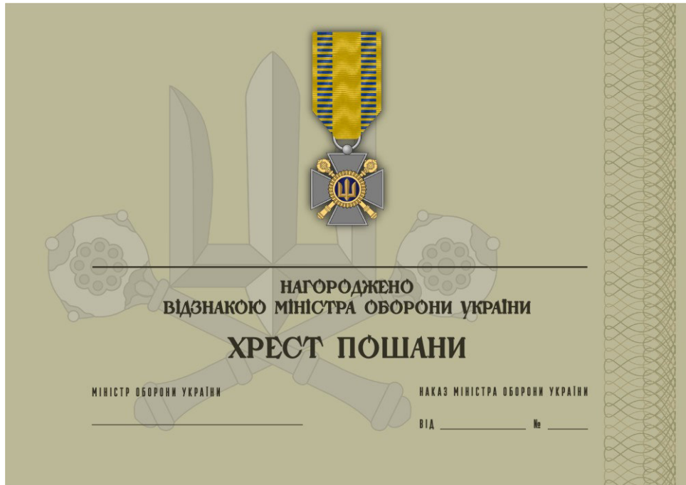
Рисунок 13 – Сертифікат до відомчої заохочувальної відзнаки Міністерства оборони України “Хрест пошани”