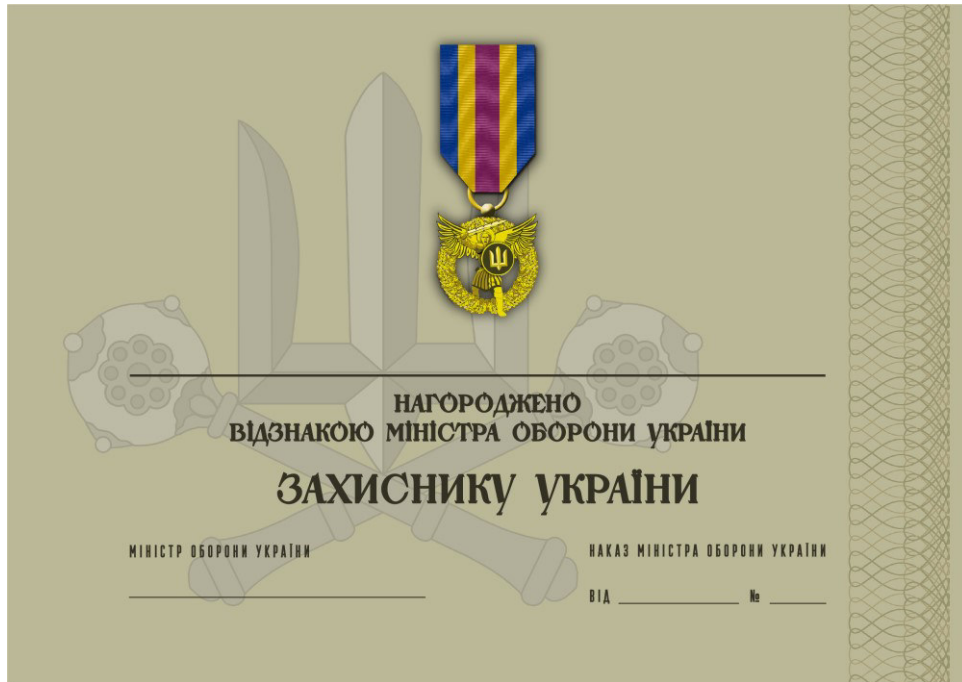
Рисунок 17 – Сертифікат до відомчої заохочувальної відзнаки Міністерства оборони України “Захиснику України”