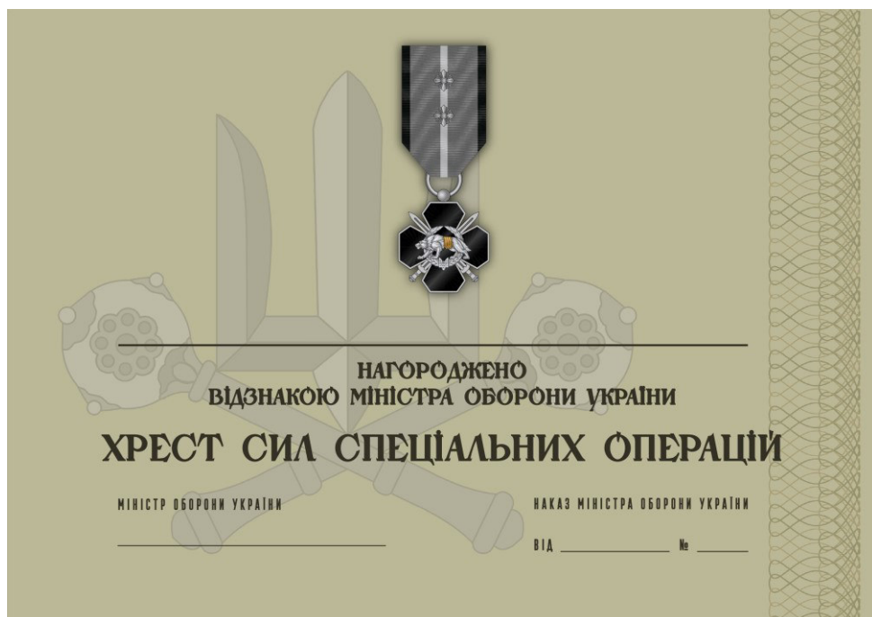
Рисунок 32 – Сертифікат до відомчої заохочувальної відзнаки Міністерства оборони України “Хрест Сил спеціальних операцій”