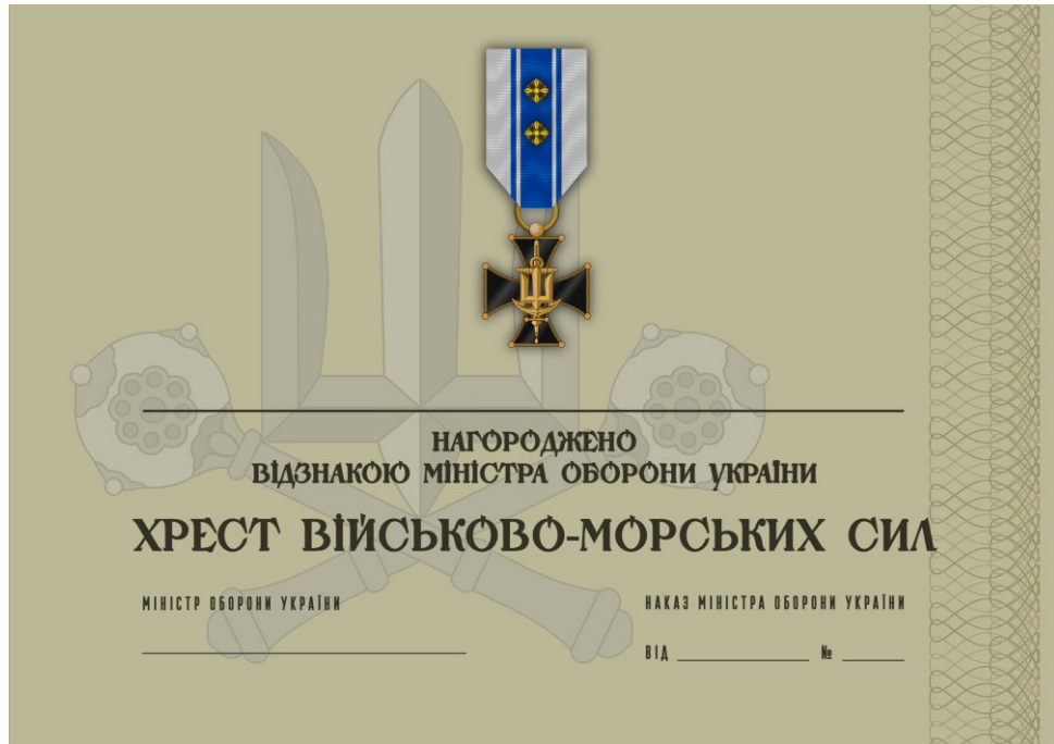
Рисунок 29 – Сертифікат до відомчої заохочувальної відзнаки Міністерства оборони України “Хрест Військово-Морських Сил”