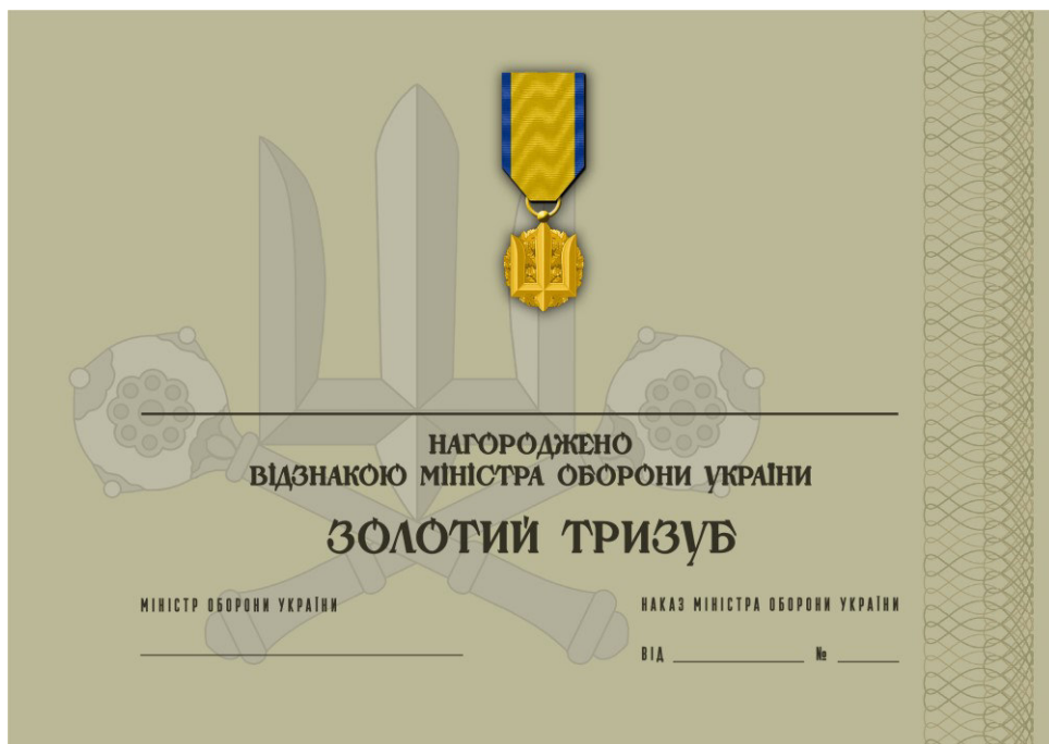
Рисунок 14 – Сертифікат до відомчої заохочувальної відзнаки Міністерства оборони України “Золотий тризуб”