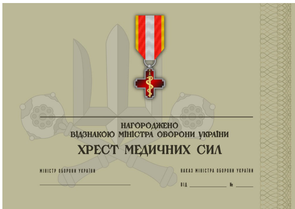
Рисунок 42 – Сертифікат до відомчої заохочувальної відзнаки Міністерства оборони України “Хрест Медичних сил”