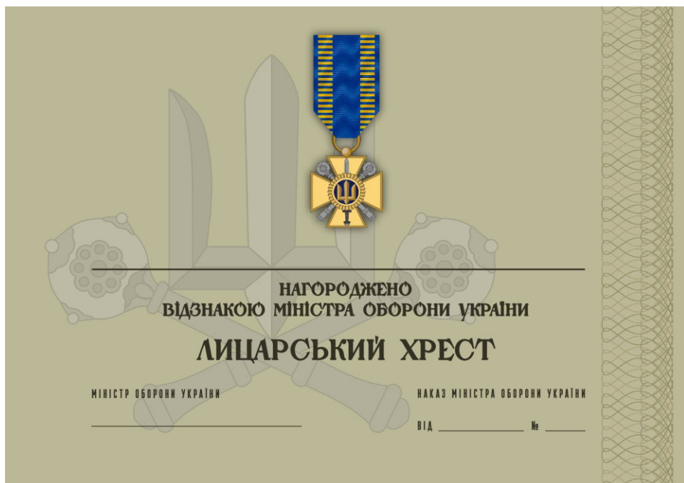
Рисунок 4 – Сертифікат до відомчої заохочувальної відзнаки Міністерства оборони України “Лицарський хрест”