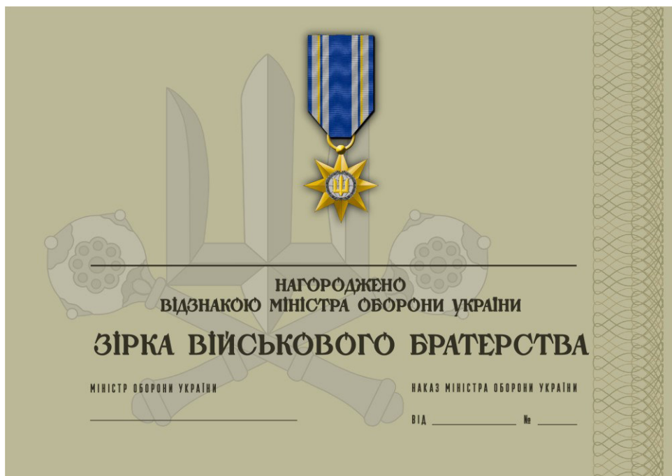
Рисунок 16 – Сертифікат до відомчої заохочувальної відзнаки Міністерства оборони України “Зірка військового братерства”