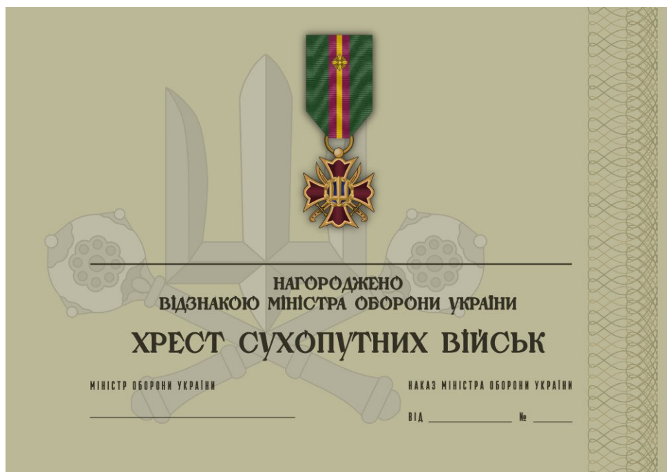
Рисунок 22 – Сертифікат до відомчої заохочувальної відзнаки Міністерства оборони України “Хрест Сухопутний військ”