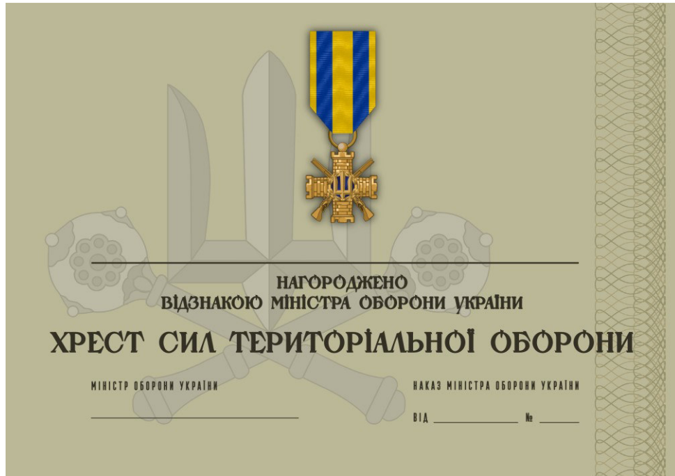
Рисунок 33 – Сертифікат до відомчої заохочувальної відзнаки Міністерства оборони України “Хрест Сил територіальної оборони”