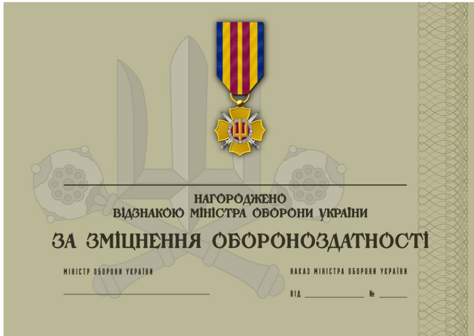
Рисунок 15 – Сертифікат до відомчої заохочувальної відзнаки Міністерства оборони України “За зміцнення обороноздатності”