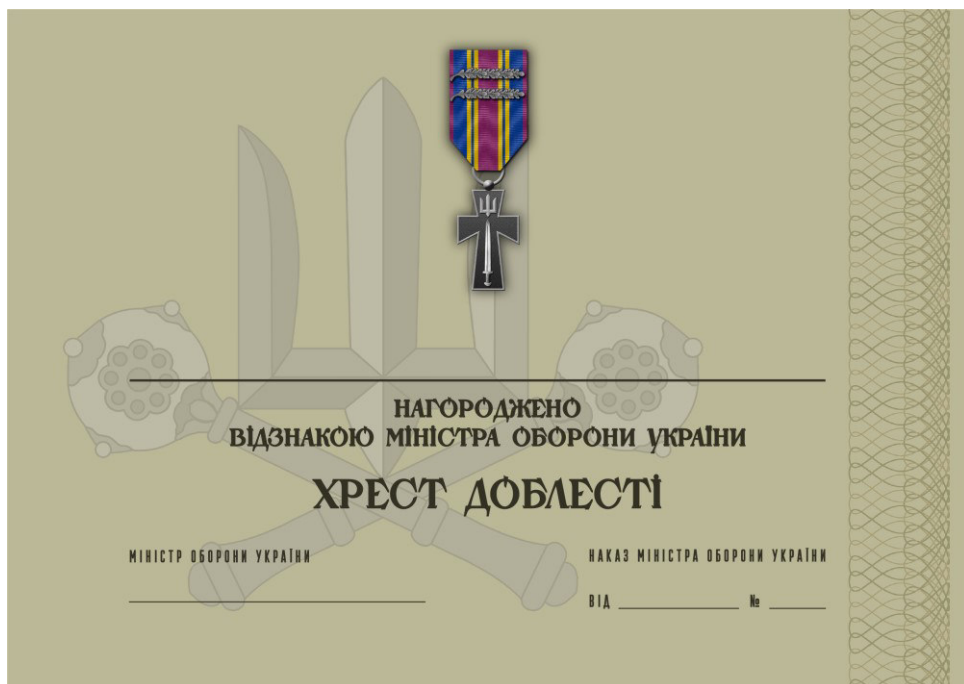
Рисунок 10 – Сертифікат до відомчої заохочувальної відзнаки Міністерства оборони України “Хрест доблесті”