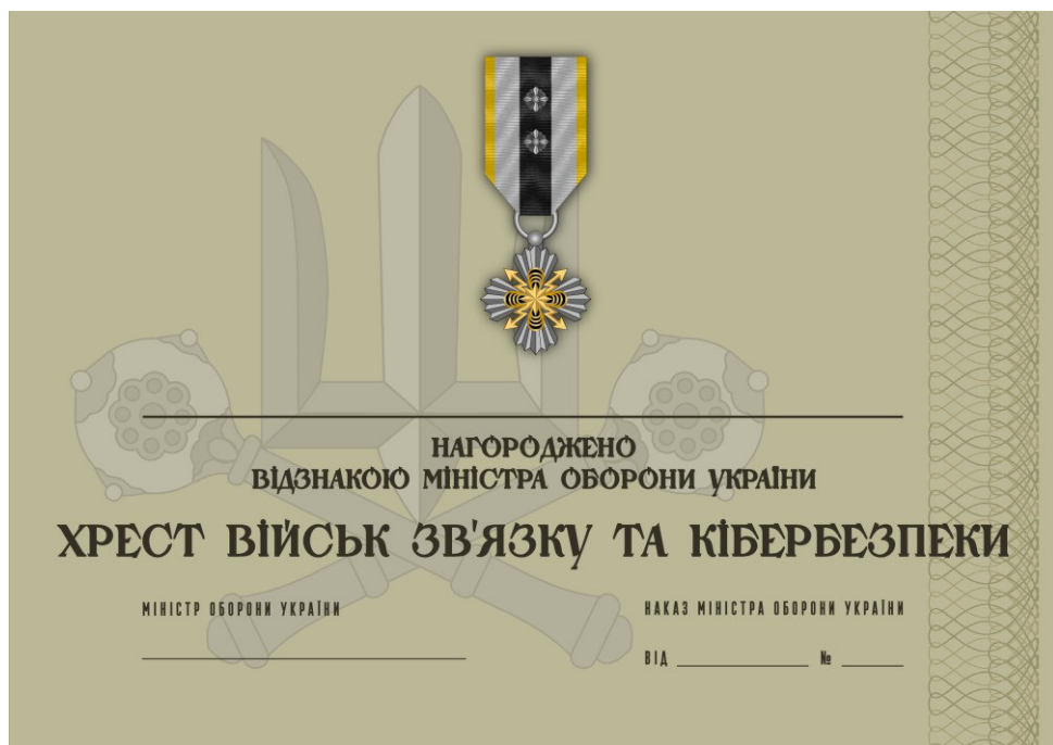
Рисунок 50 – Сертифікат до відомчої заохочувальної відзнаки Міністерства оборони України “Хрест Військ зв’язку та кібербезпеки”