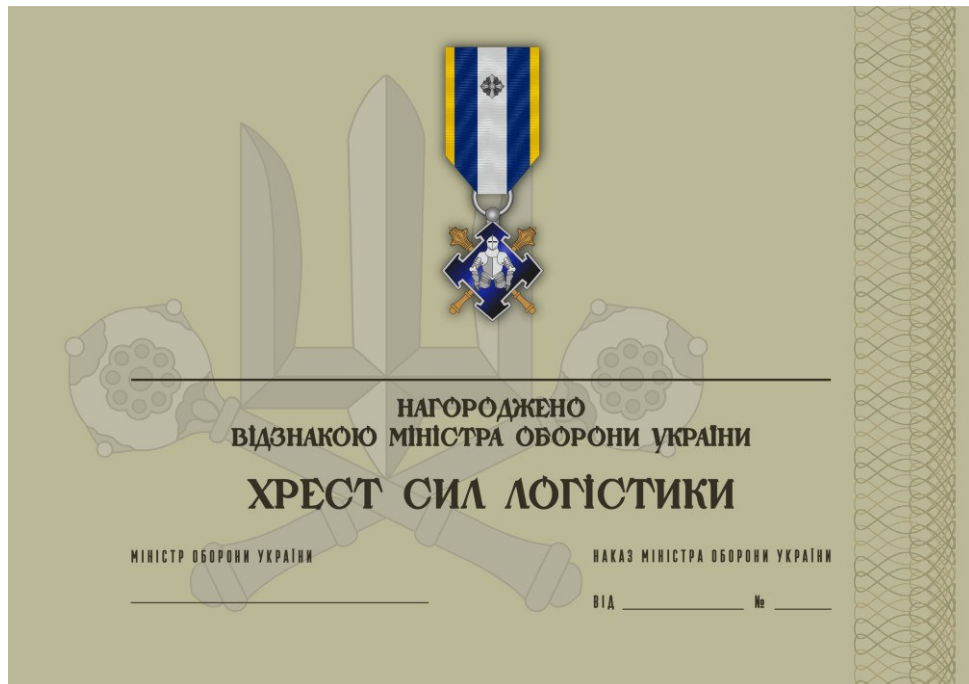
Рисунок 37 – Сертифікат до відомчої заохочувальної відзнаки Міністерства оборони України “Хрест Сил логістики”