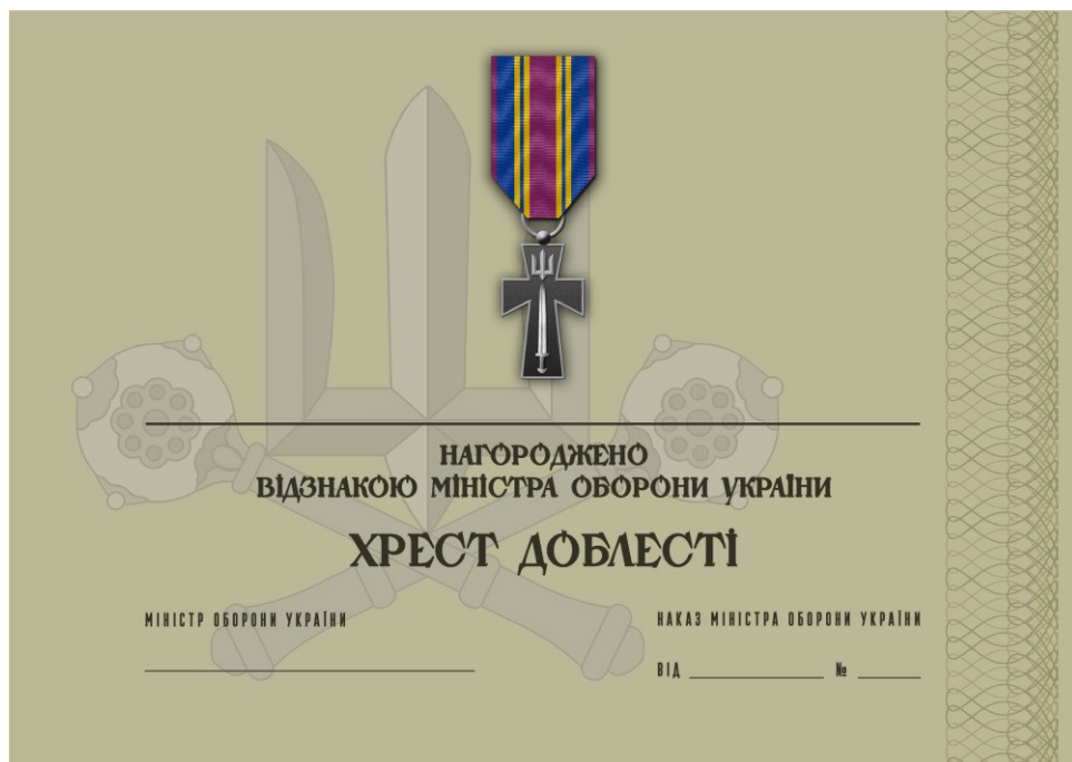
Рисунок 8 – Сертифікат до відомчої заохочувальної відзнаки Міністерства оборони України “Хрест доблесті”