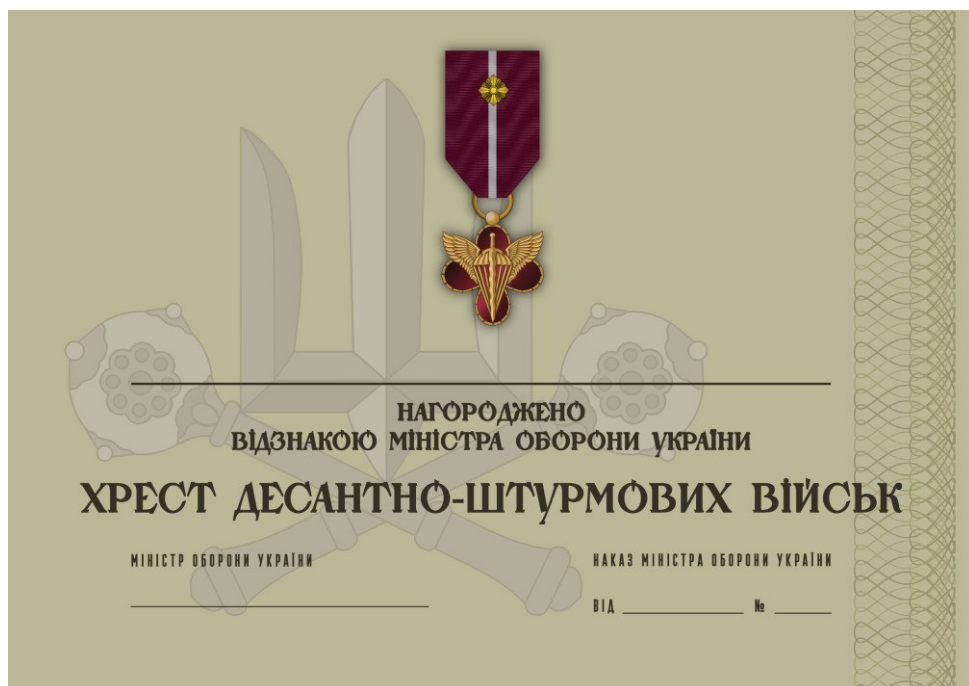
Рисунок 46 – Сертифікат до відомчої заохочувальної відзнаки Міністерства оборони України “Хрест Десантно-штурмових військ”