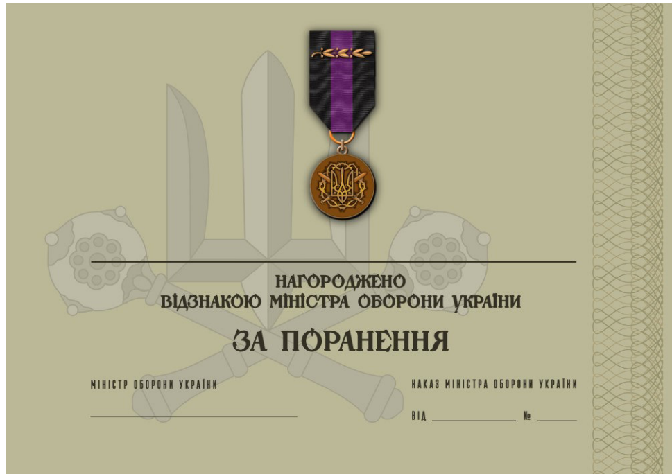
Рисунок 11 – Сертифікат до відомчої заохочувальної відзнаки Міністерства оборони України “За поранення”