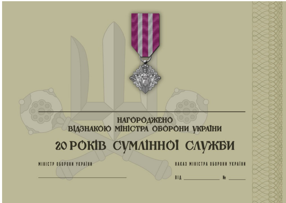
Рисунок 59 – Сертифікат до відомчої заохочувальної відзнаки Міністерства оборони України “20 років сумлінної служби”