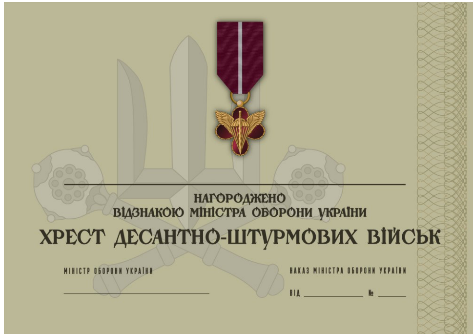
Рисунок 45 – Сертифікат до відомчої заохочувальної відзнаки Міністерства оборони України “Хрест Десантно-штурмових військ”