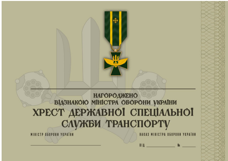
Рисунок 55 – Сертифікат до відомчої заохочувальної відзнаки Міністерства оборони України “Хрест Державної спеціальної служби транспорту”