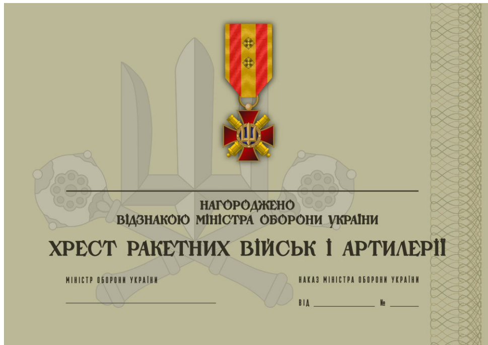
Рисунок 53 – Сертифікат до відомчої заохочувальної відзнаки Міністерства оборони України “Хрест ракетних військ і артилерії”