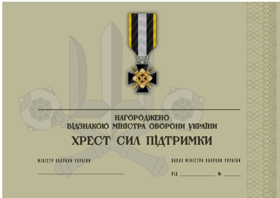
Рисунок 39 – Сертифікат до відомчої заохочувальної відзнаки Міністерства оборони України “Хрест Сил підтримки”