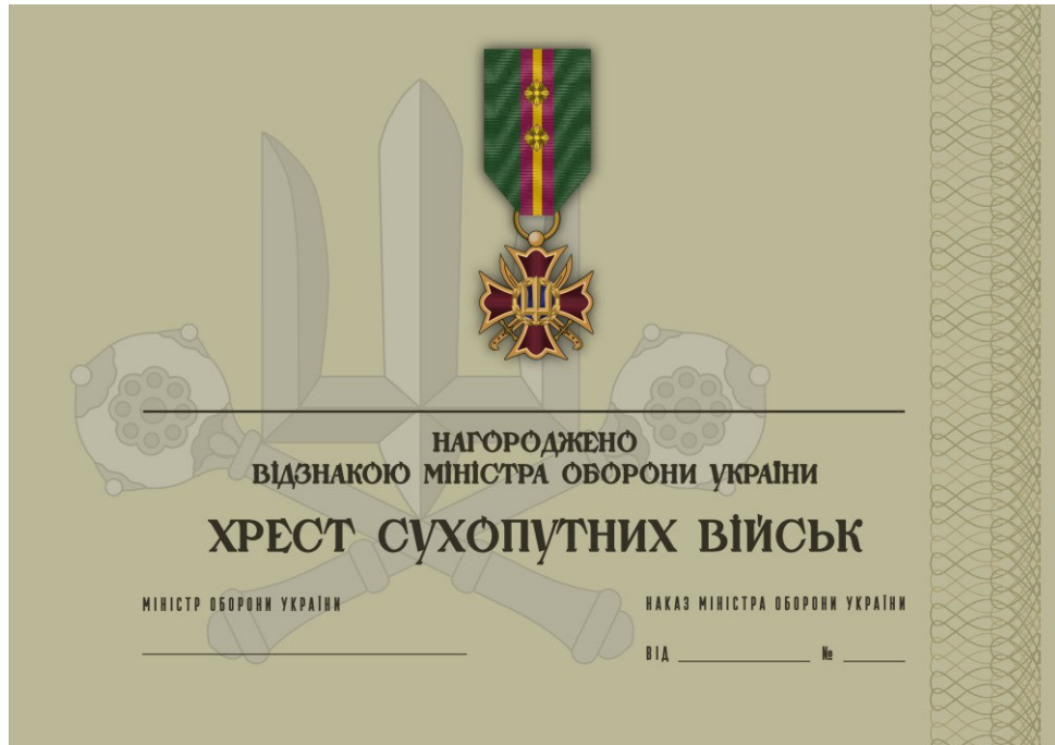
Рисунок 23 – Сертифікат до відомчої заохочувальної відзнаки Міністерства оборони України “Хрест Сухопутний військ”