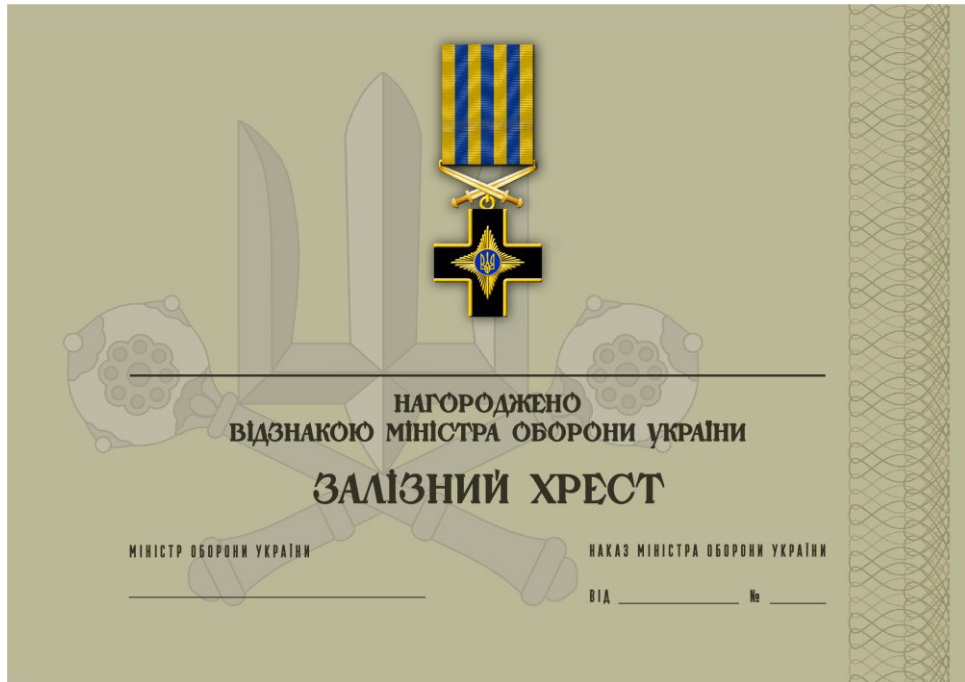
Рисунок 3 – Сертифікат до відомчої заохочувальної відзнаки Міністерства оборони України “Залізний хрест”