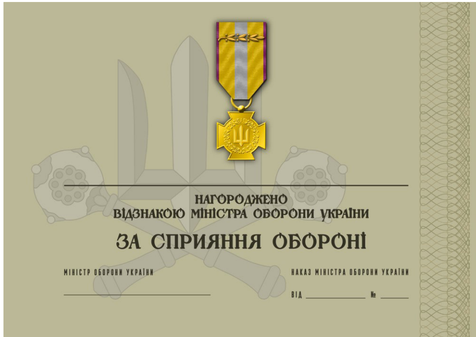
Рисунок 19 – Сертифікат до відомчої заохочувальної відзнаки Міністерства оборони України “За сприяння обороні”