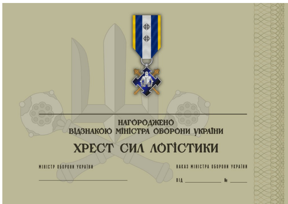
Рисунок 38 – Сертифікат до відомчої заохочувальної відзнаки Міністерства оборони України “Хрест Сил логістики”