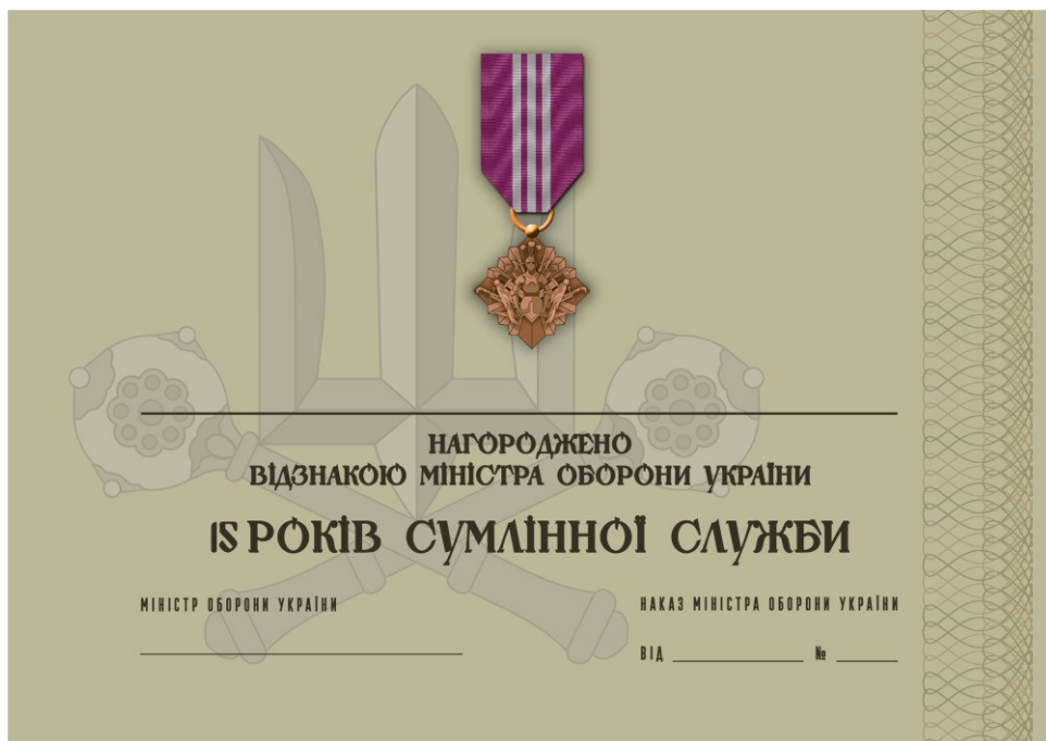
Рисунок 60 – Сертифікат до відомчої заохочувальної відзнаки Міністерства оборони України “15 років сумлінної служби”