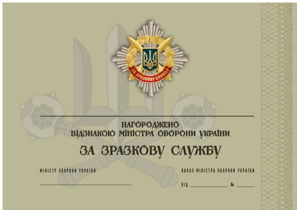
Рисунок 2 – Сертифікат до відомчої заохочувальної відзнаки Міністерства оборони України “За зразкову службу”