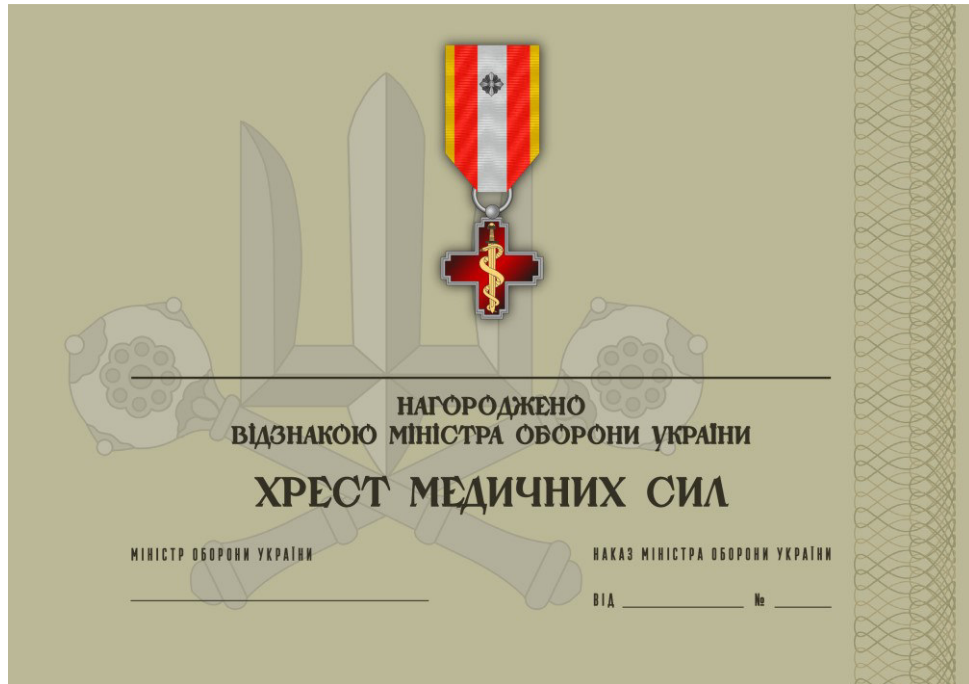
Рисунок 43 – Сертифікат до відомчої заохочувальної відзнаки Міністерства оборони України “Хрест Медичних сил”