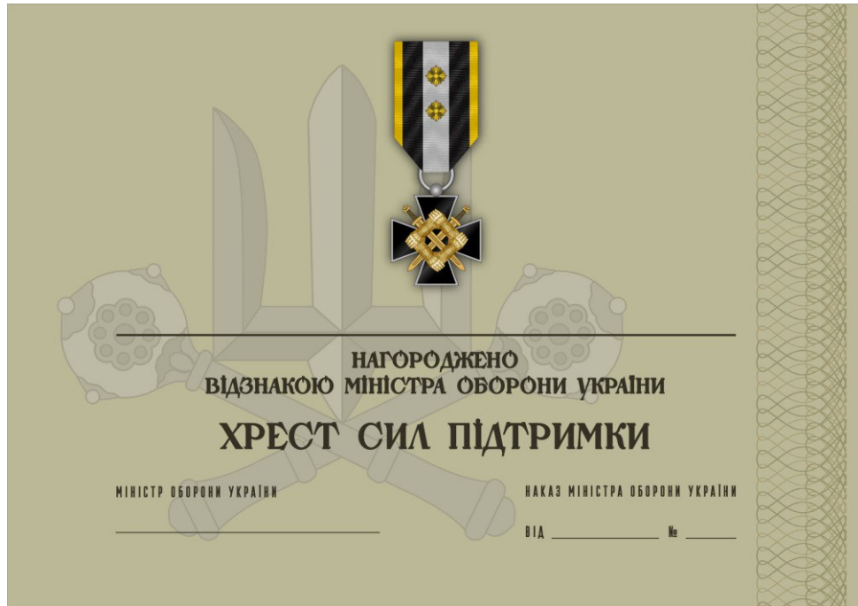
Рисунок 41 – Сертифікат до відомчої заохочувальної відзнаки Міністерства оборони України “Хрест Сил підтримки”