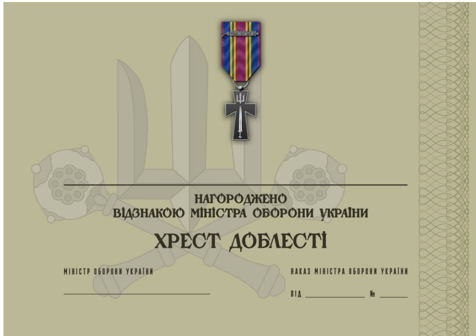
Рисунок 9 – Сертифікат до відомчої заохочувальної відзнаки Міністерства оборони України “Хрест доблесті”