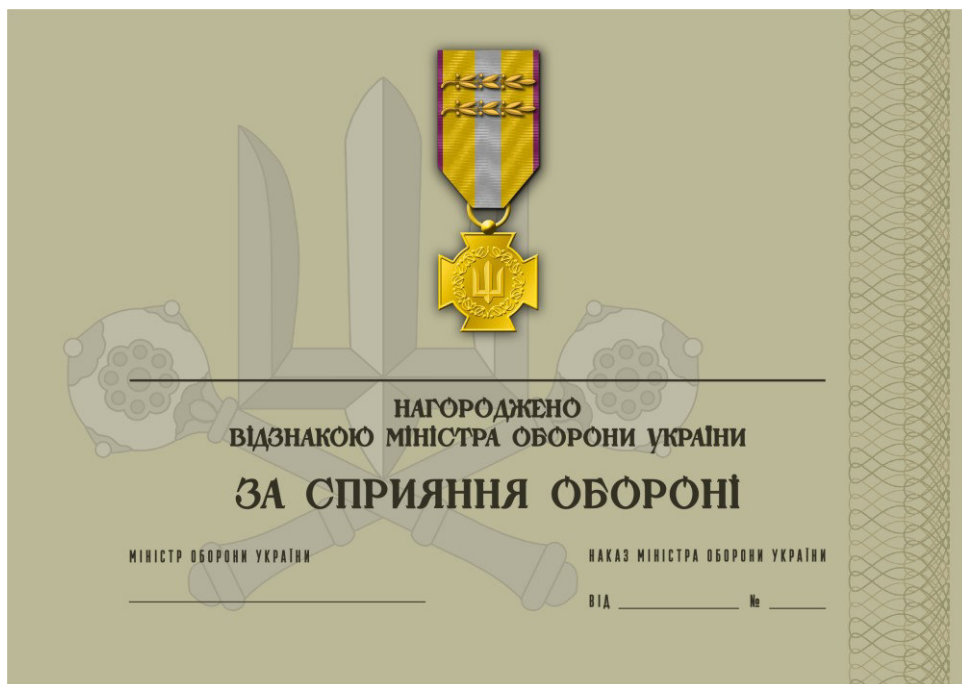
Рисунок 20 – Сертифікат до відомчої заохочувальної відзнаки Міністерства оборони України “За сприяння обороні”