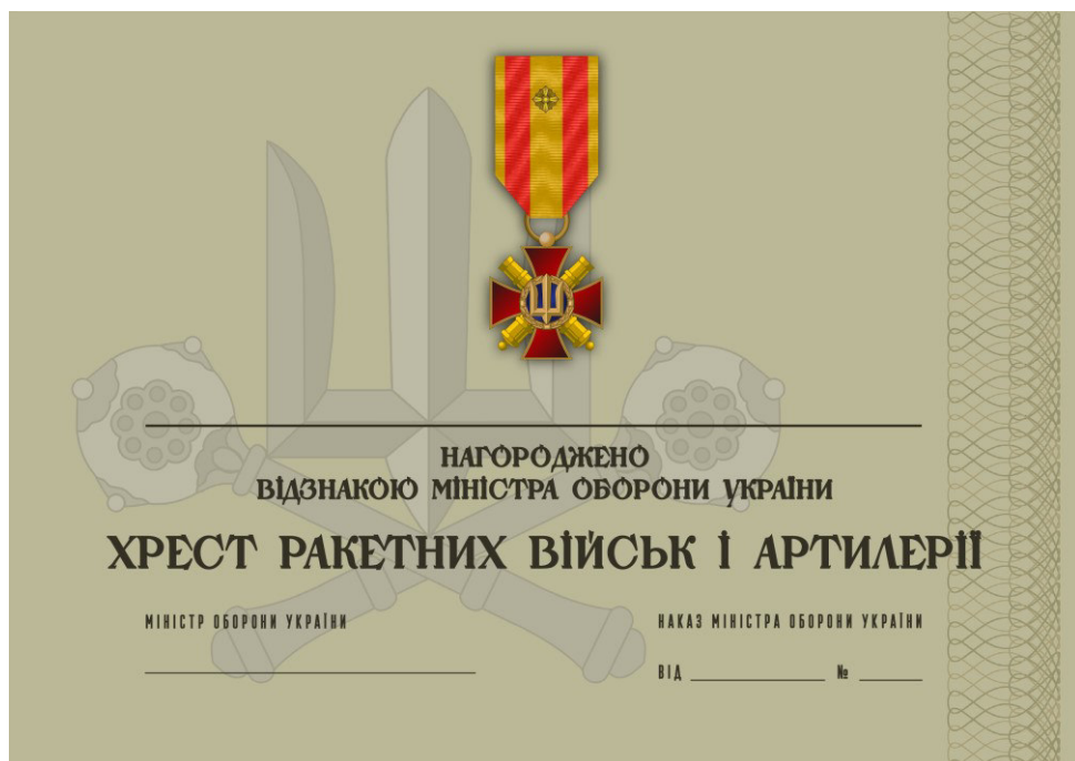
Рисунок 52 – Сертифікат до відомчої заохочувальної відзнаки Міністерства оборони України “Хрест ракетних військ і артилерії”