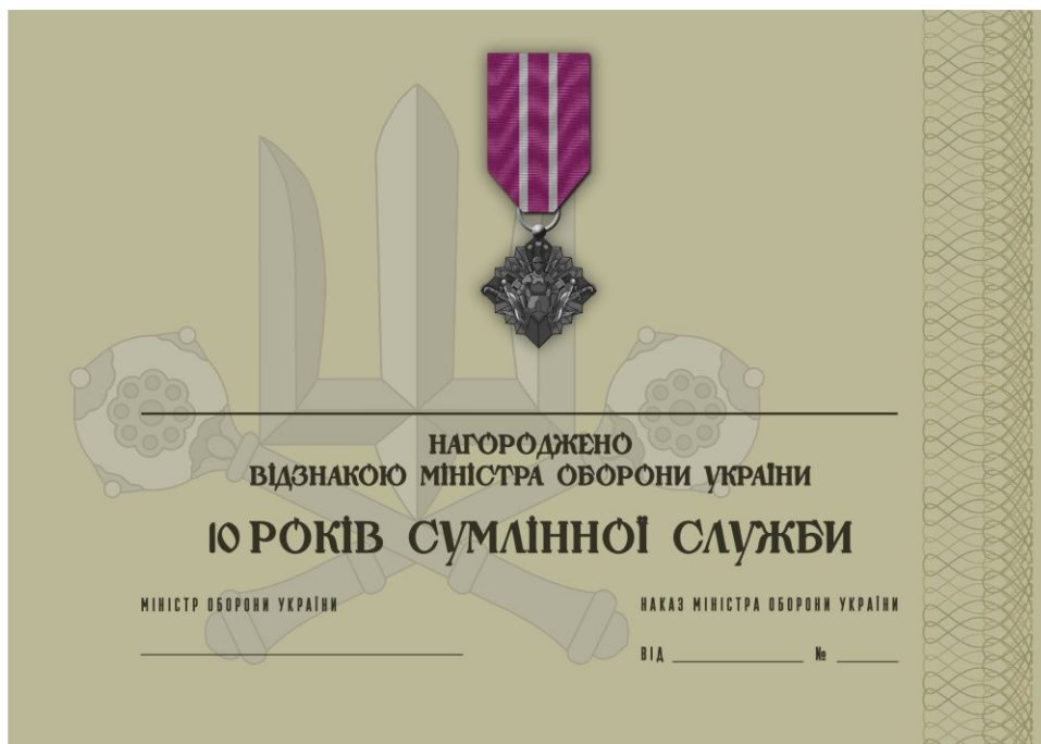
Рисунок 61 – Сертифікат до відомчої заохочувальної відзнаки Міністерства оборони України “10 років сумлінної служби”