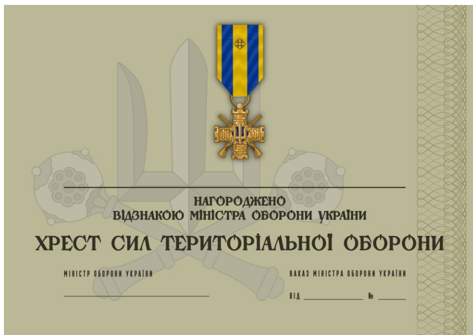
Рисунок 34 – Сертифікат до відомчої заохочувальної відзнаки Міністерства оборони України “Хрест Сил територіальної оборони”