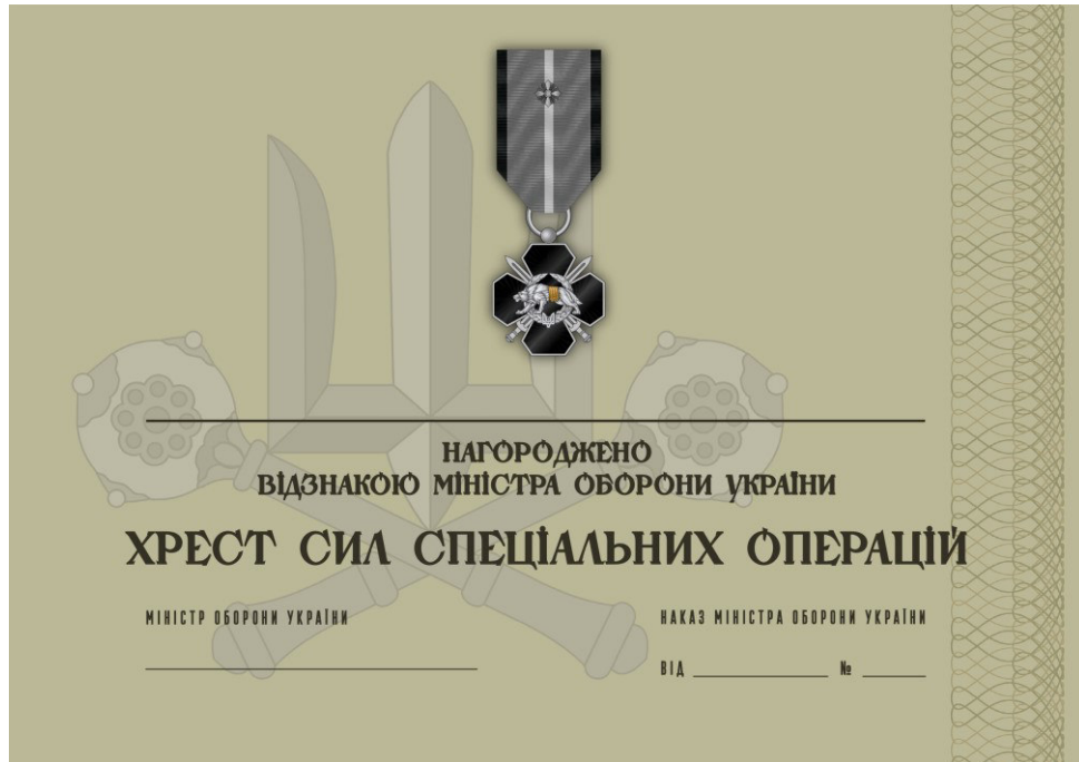
Рисунок 31 – Сертифікат до відомчої заохочувальної відзнаки Міністерства оборони України “Хрест Сил спеціальних операцій”