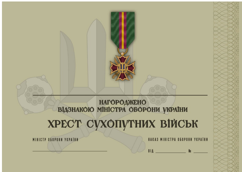
Рисунок 21 – Сертифікат до відомчої заохочувальної відзнаки Міністерства оборони України “Хрест Сухопутний військ”