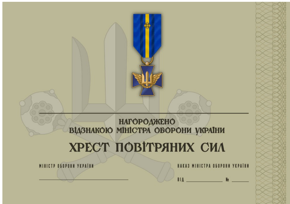
Рисунок 25 – Сертифікат до відомчої заохочувальної відзнаки Міністерства оборони України “Хрест Повітряних Сил”