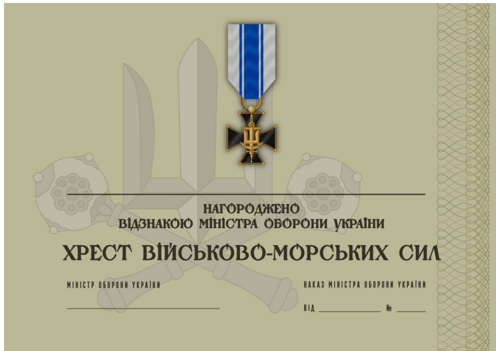
Рисунок 27 – Сертифікат до відомчої заохочувальної відзнаки Міністерства оборони України “Хрест Військово-Морських Сил”