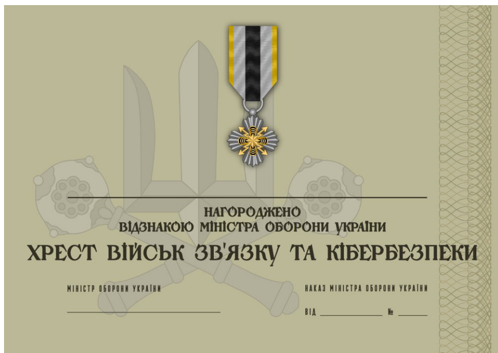
Рисунок 48 – Сертифікат до відомчої заохочувальної відзнаки Міністерства оборони України “Хрест Військ зв’язку та кібербезпеки”