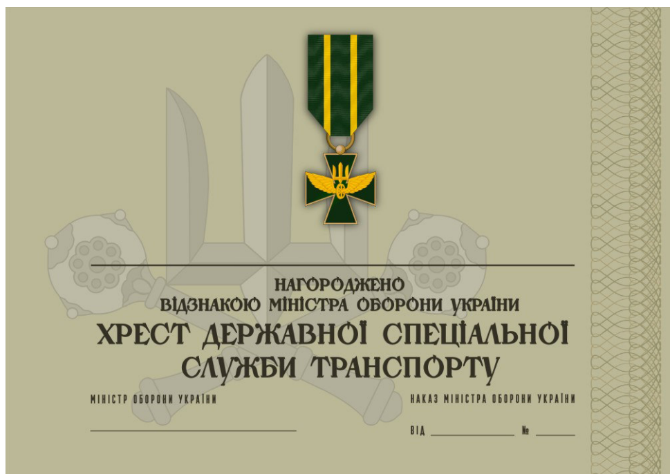
Рисунок 54 – Сертифікат до відомчої заохочувальної відзнаки Міністерства оборони України “Хрест Державної спеціальної служби транспорту”