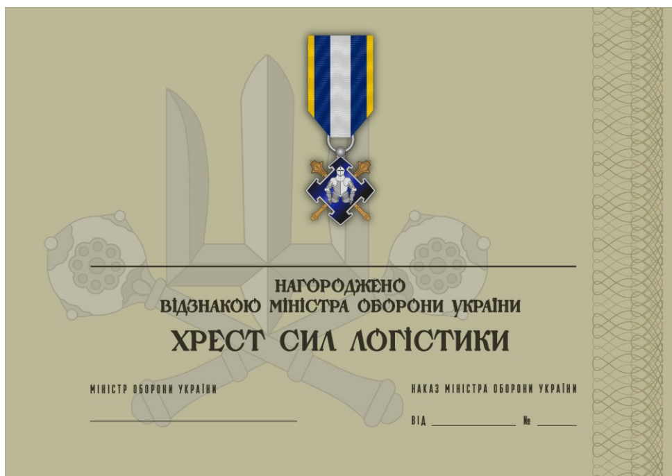
Рисунок 36 – Сертифікат до відомчої заохочувальної відзнаки Міністерства оборони України “Хрест Сил логістики”