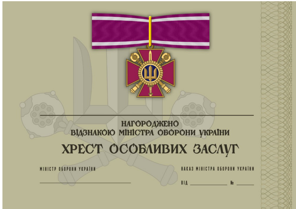
Рисунок 1 – Сертифікат до відомчої заохочувальної відзнаки Міністерства оборони України “Хрест особливих заслуг”