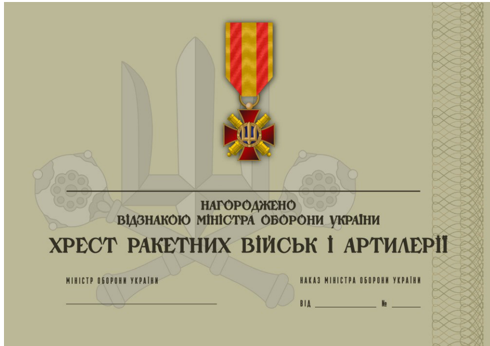
Рисунок 51 – Сертифікат до відомчої заохочувальної відзнаки Міністерства оборони України “Хрест ракетних військ і артилерії”