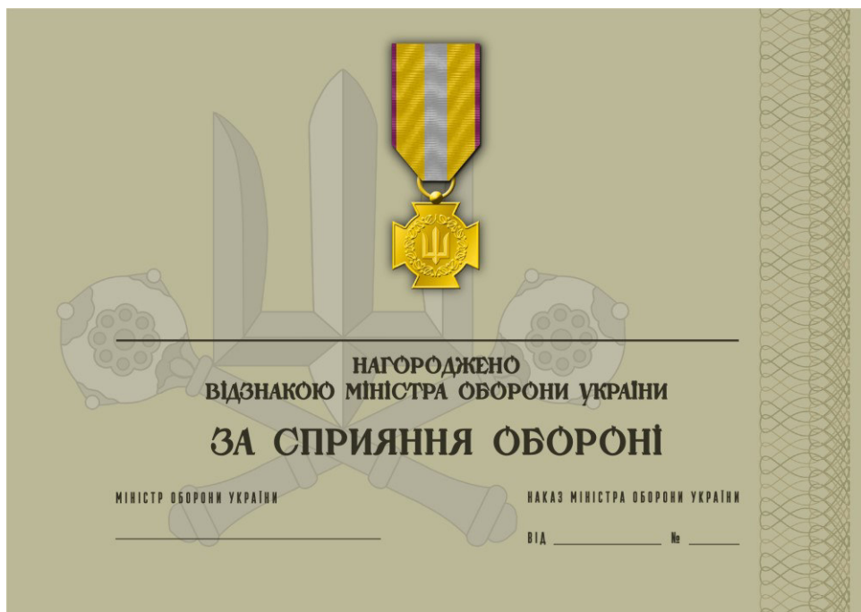
Рисунок 18 – Сертифікат до відомчої заохочувальної відзнаки Міністерства оборони України “За сприяння обороні”