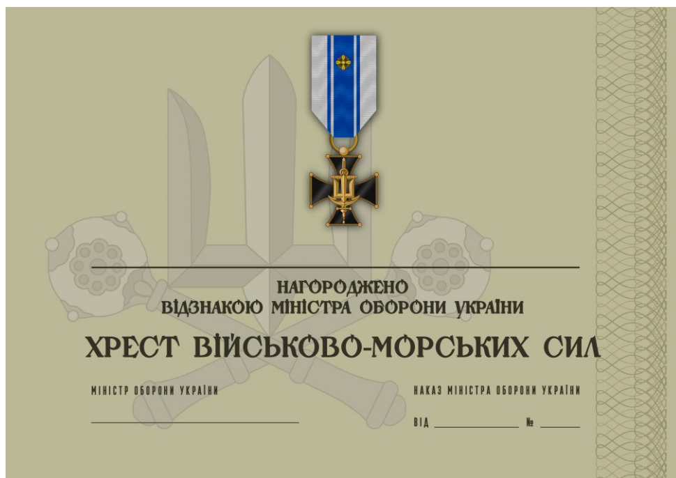
Рисунок 28 – Сертифікат до відомчої заохочувальної відзнаки Міністерства оборони України “Хрест Військово-Морських Сил”