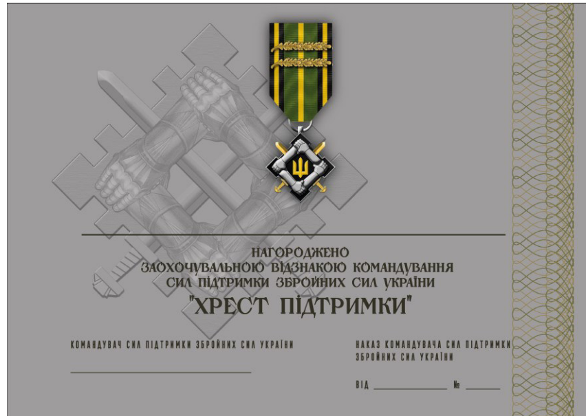
Рисунок 3 – посвідчення до відзнаки Командування Сил підтримки Збройних Сил України “Хрест підтримки”