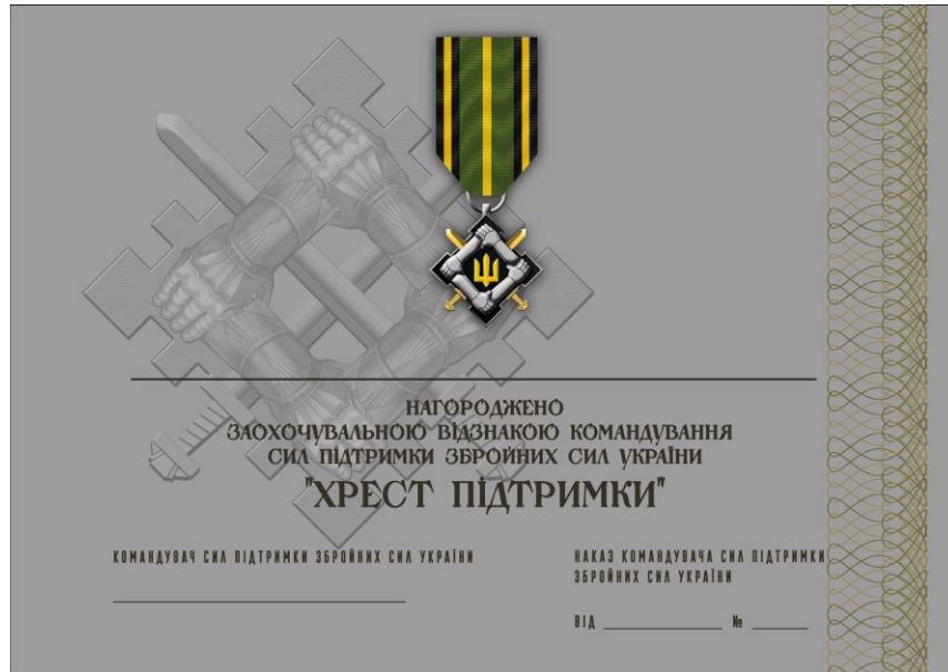
Рисунок 1 – посвідчення до відзнаки Командування Сил підтримки Збройних Сил України “Хрест підтримки”