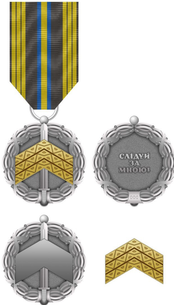
Рисунок Д1.1 – Зовнішній вигляд предмета