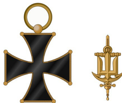
Рисунок Д1.2 – Зовнішній вигляд предмета