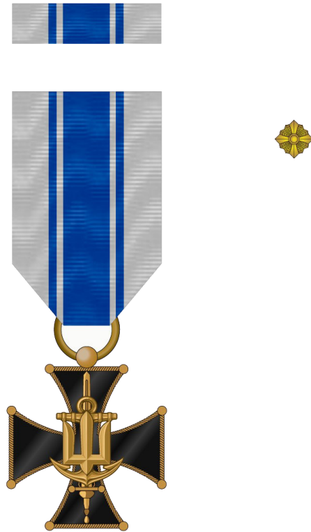
Рисунок Д1.1 – Зовнішній вигляд предмета