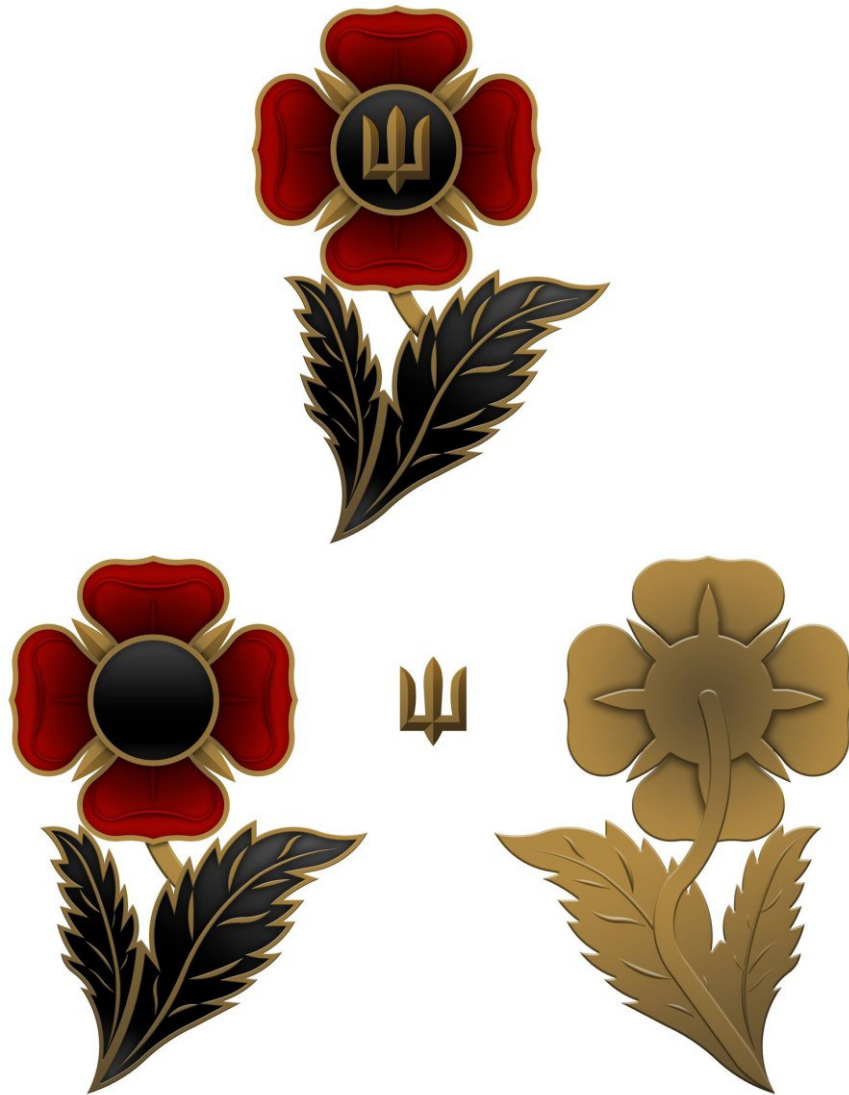
Рисунок Д1.1 – Зовнішній вигляд предмета